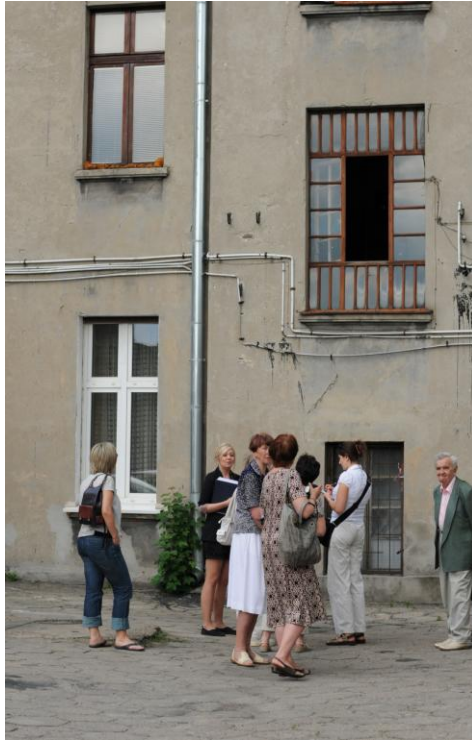
Kolejne miejsce zamieszkania Karla Dedeciusa, ul. Przędzalniana