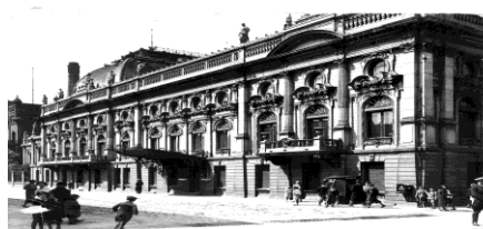
Pałac Izraela Poznańskiego , obecnie siedziba Muzeum Miasta Łodzi, ul. Ogrodowa 15

Kolejnym miejscem, w którym się zatrzymamy, jest monumentalny i zachwycający Pałac Izraela Poznańskiego. Co łączy skromnego gimnazjalistę z dawnym łódzkim fabrykantem? W pałacu mieści się teraz Muzeum Historii Miasta Łodzi, w którym od 1999 r. można zwiedzać stałą ekspozycję poświęconą Karlowi Dedeciusowi w ramach Panteonu Wielkich Łodzian. Obok znajdują się sale innych „Wielkich Ludzi Ziemi Obiecanej”, między innymi Juliana Tuwima, Artura Rubinsteina oraz Władysława Reymonta. Kto by się spodziewał, że Karl Dedecius stanie się tak ważną postacią dla naszego miasta i Europy.