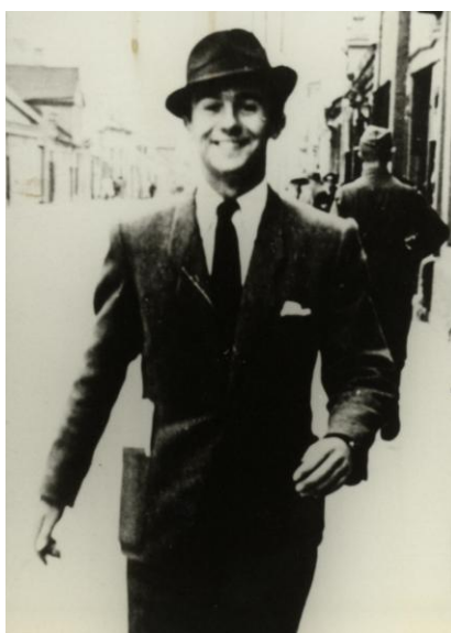
Karl Dedecius, spacer po łódzkiej ulicy, 1939 r.

Łódź dziś nie przypomina miasta z XIX wieku – jednego z największych ośrodków przemysłowych kraju, miasta, które przyciągało ludzi z całej Polski i Europy – z Niemiec, Czech i Rosji. Dzięki tej niezwyklej przeszłości, której ślady odkrywam nieustannie, Łódź jest dla mnie (nie-łodzianki z urodzenia) miejscem magicznym. Wiele z tego, co działo się tutaj kiedyś, ginie w mrokach niepamięci, jednakże śledzenie biografii Karla Dedeciusa umożliwia podróż w przeszłość Łodzi. Wędrówka śladami Mistrza pozwala odkryć nie tylko duszę tego miasta, ale także daje szansę poznania siebie, czego życzę wszystkim, którzy wybiorą się w podróż do miejsc związanych z postacią Karla Dedeciusa.