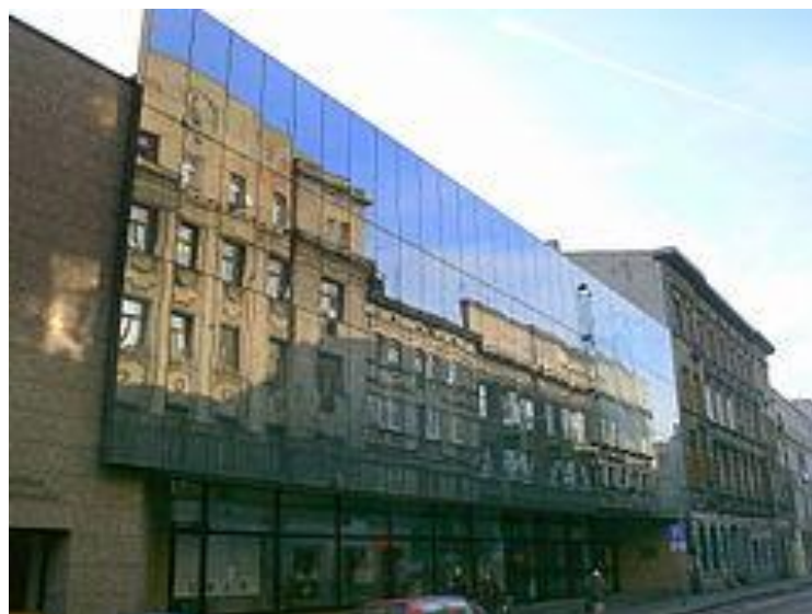
Teatr im. Stefana Jaracza w Łodzi, ul. Jaracza 27