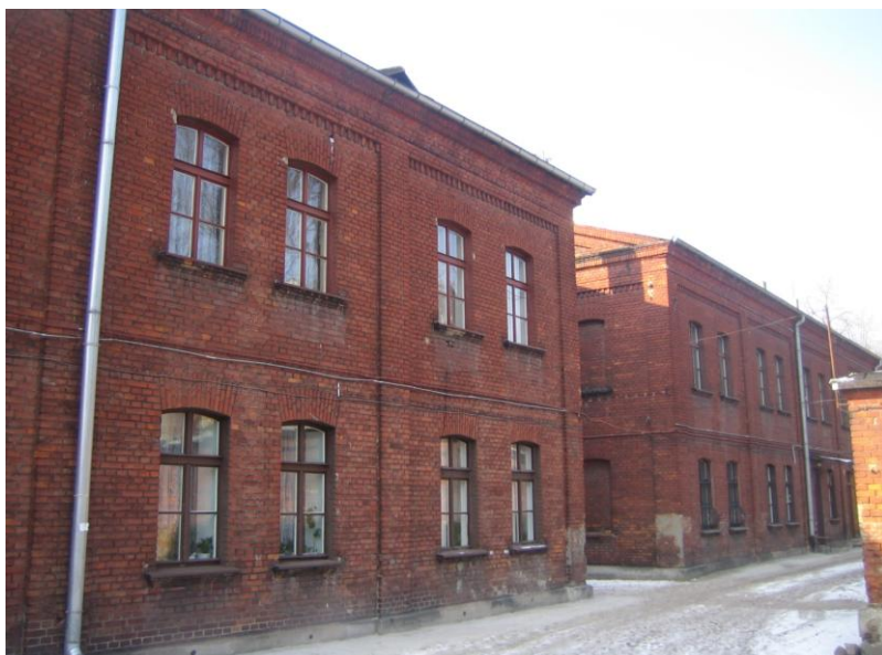
Dom robotniczy na Księżym Młynie

„Godzinami wystawałem przy oknie kuchennym albo siedziałem na jego szerokim parapecie i obserwowałem z zainteresowaniem, co się dzieje na ulicy”.