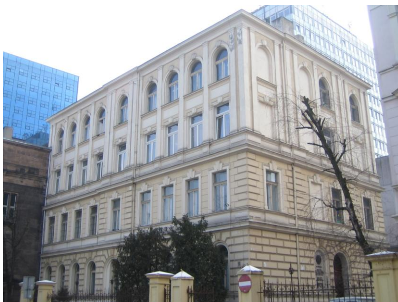
Budynek przedwojennego Gimnazjum im. Stefana Żeromskiego przy ul. Ewangelickiej 13 (dziś Roosevelta) w Łodzi