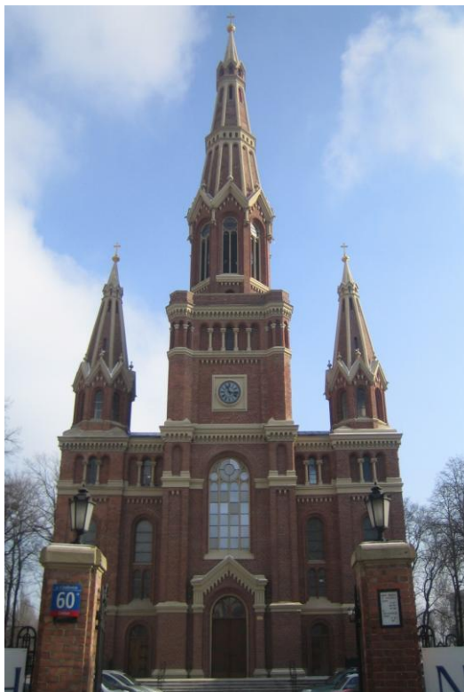
Kościół Jezuitów w Łodzi, dawniej świątynia ewangelicko-augsburska pw. Jana Ewangelisty, ul. Sienkiewicza 60

W naszej podróży po Łodzi pozostajemy jeszcze przez chwilę na ulicy Roosevelta. U jej wylotu góruje nad kamienicami wieża Kościoła ojców Jezuitów. Do 1945 roku była to świątynia ewangelicko-augsburska pod wezwaniem Jana Ewangelisty. To w tym kościele matka profesora – bardzo religijna luteranka- w każdą niedzielę modliła się i słuchała kazań pastora. Dla dorastającego Karla miejsce to też było szczególne – z innego powodu. „Magicznie przyciągającym miejscem stał się dla mnie wspomniany już kościół św. Jana, znajdował się zaledwie kilka metrów od szkoły, na końcu ulicy Ewangelickiej. Tam w godzinach przedpołudniowych organista ćwiczył fugi, kanony i chorały, dzieła organowe Bacha, Mendelssohna-Bartholdy’ego oraz Schumanna. Były to moje pierwsze ekstatyczne muzyczne przeżycia. Aby jednak ich doświadczyć, uczestniczyć w takim koncercie, a raczej próbach do niego, trzeba było iść na wagary, na godzinę lub nawet więcej. Ryzykowałem, czasem udawało się mi wymknąć niepostrzeżenie, ale kilka razy mnie złapano, a nieobecności odnotowano na świadectwie rocznym jako godziny nieusprawiedliwione”.