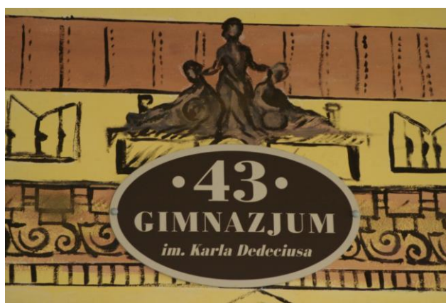
Malowidło i napis w holu Publicznego Gimnazjum nr 43 im. Karla Dedeciusa w Łodzi, ul Powszechna 15

W Łodzi znajduje się również gimnazjum imienia Karla Dedeciusa (to jedyna szkoła w Polsce, której patronuje wybitny tłumacz). Podczas nadania szkole imienia w 2002 r. Karl Dedecius zwrócił się do młodzieży: „ Nie marnujcie tych lat , które nigdy więcej nie będą Wam dane ”. Radził młodym ludziom, by nie przywiązywali wagi do rzeczy błahych i zbędnych.