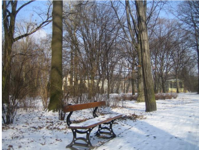
Laweczka w Parku Poniatowskiego