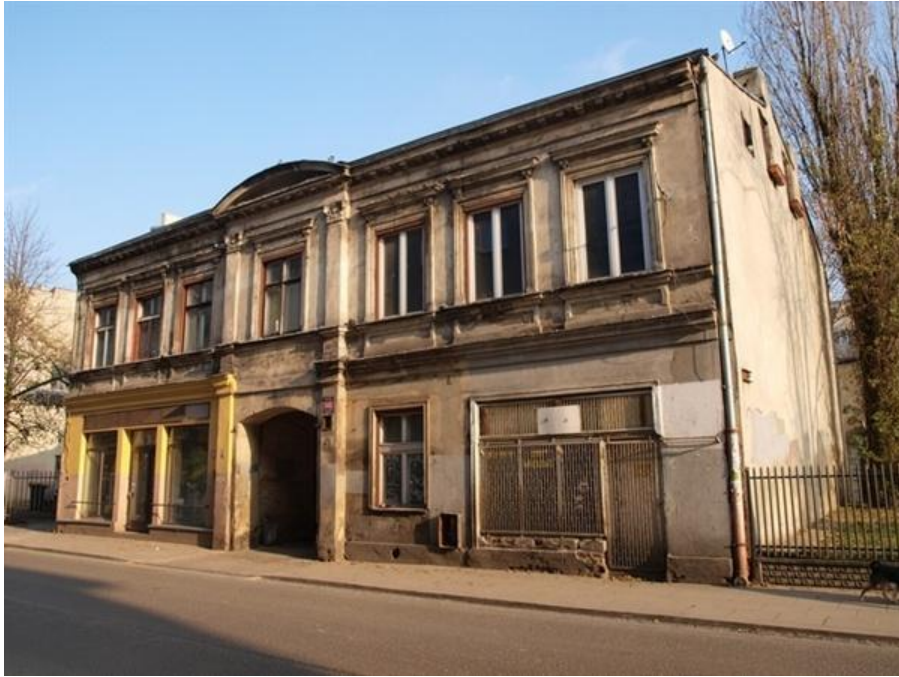
Dom urodzenia Karla Dedeciusa, ul. Wólczańska 146

W podróży śladami Karla Dedeciusa możemy wybrać się do unikalnego osiedla dla robotników – Księży Młyn, które dziś stanowi jedną z najważniejszych pamiątek po przemysłowej Łodzi i główną atrakcję turystyczną miasta. Przy ulicy Przędzalnianej (numer domu nie zachował się w dokumentach) znajduje się kamienica, w której mieszkał mały Karl Dedecius.